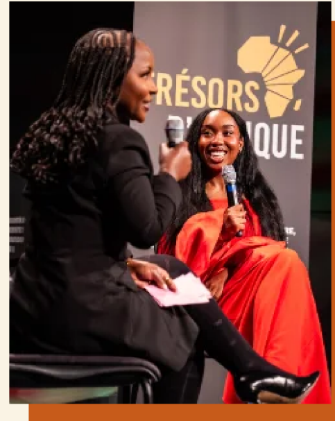
Discussion avec la réalisatrice en salle IMAX du Vieux-Port.

Vidéaste et réalisatrice franco-camerounaise suivie par 1,4 million d'abonnés, Sally s'est imposée comme une figure majeure de la nouvelle génération de créateur·rices qui racontent l'Afrique autrement — loin des clichés, à hauteur de quotidien, de patrimoine et de jeunesse. Sa série documentaire Motherland , lancée en 2021, a exploré la Côte d'Ivoire, le Sénégal, le Cameroun et la RDC avant le Bénin. L'épisode béninois, consacré à la spiritualité, a fait salle comble au Grand Rex de Paris en septembre 2025, avant une projection officielle à Cotonou. En accueillant Sally, Trésors d'Afrique a fait de Montréal une étape de ce parcours — après Paris et Cotonou.