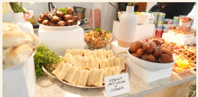
Tablée du brunch · échanges avec Sally · photo de groupe · détails de l'événement